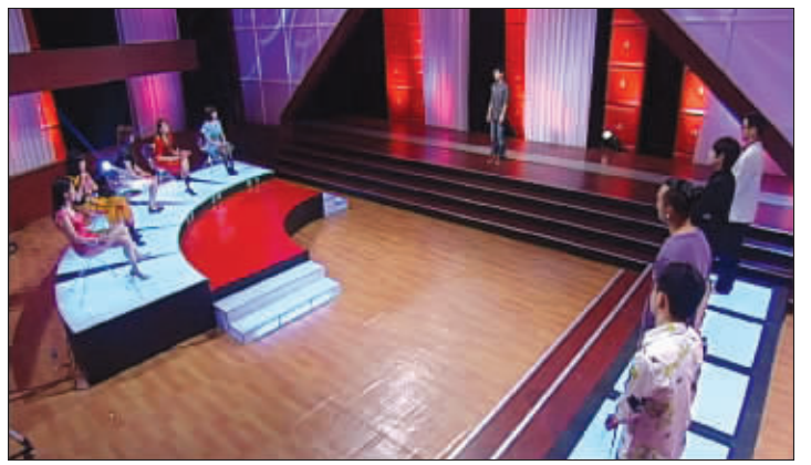
男的传送上来,接受女嘉宾挑选

记者了解到,当红的相亲节目《非诚勿扰》与英国的相亲节目《take me out》有异曲同工之妙,而这档《爱情传送带》则借鉴了今年1月在BBC播出过的一档《爱的传送带》。当时,该节目被视为《take me out》的“挑战者”,得到观众密切关注。在《爱的传送带》中,男人们站在传送带上,4个女生坐在格子间里,男人们被传送到女生面前,女生们就可以举牌子,表示要或者不要,有了更好的,还可以把以前选择过的男生剔除。曾有媒体评论