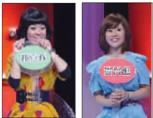
看中说“喜欢”,否则“没兴趣”