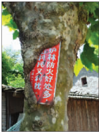
这块宣传牌被树干包围起来, 看来大树已经把护林防火牢记心中! (作者李文辉将获30元话费)