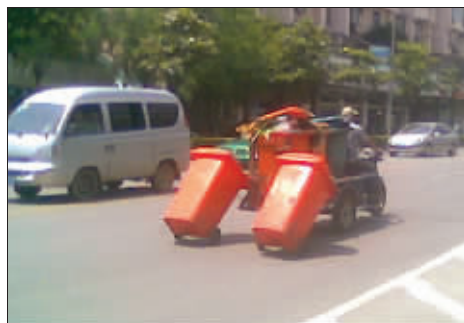
拖拖拉拉的环卫车, 稀里哗啦地开。看来, 拖运垃圾桶的办法没有最强只有更强。5月25日摄于后宰门 (作者叮嗒将获30元话费)