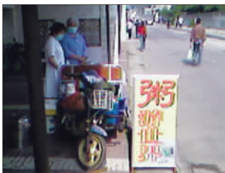
吃早饭时看到有一位骑摩托三轮卖粥的大妈, 卖粥环游世界, 不知下个城市是哪里。5月25日摄于南京炼油厂生活区 (作者我心乐驰将获30元话费)