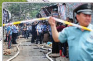
巷子很窄,只得接水灭火