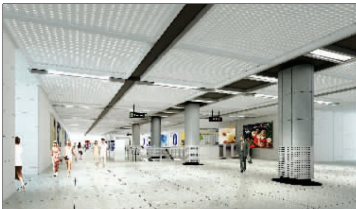
建成后的地铁 1 号线南禅寺站宽敞、明亮,现代化气息浓郁(效果图)

按照设计,地铁 1 号线南禅寺地下站点,有地下两层,在二院、南禅寺以及南城门外等位置总共设置 8 个出入口。整个工程一期需要施工 5 个月,二期要 10 个月,16 个月左右后,相关封闭道路将恢复正常通行。其中,一期工程主要是指现在目前进行的中山南路东半幅封闭施工,二期工程则是指在东半幅施工结束之后,开始西半幅封闭施工。 薛晨