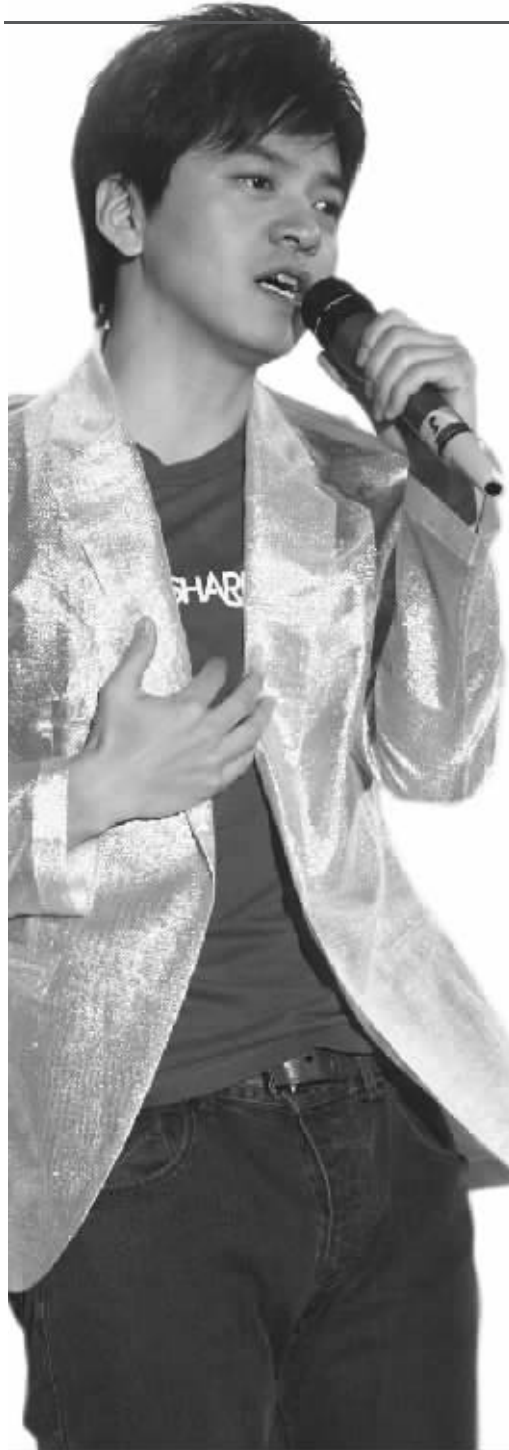
李健唱响原版《传奇》