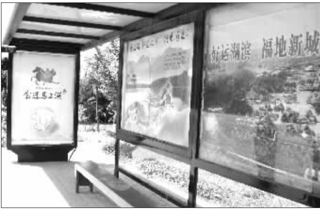
公交站台已经换上了马上湖的“行运”介绍

在宿迁,“湖”的发音与“福”相似,可以理解为“马上福,马上有福;马上湖,也可以理