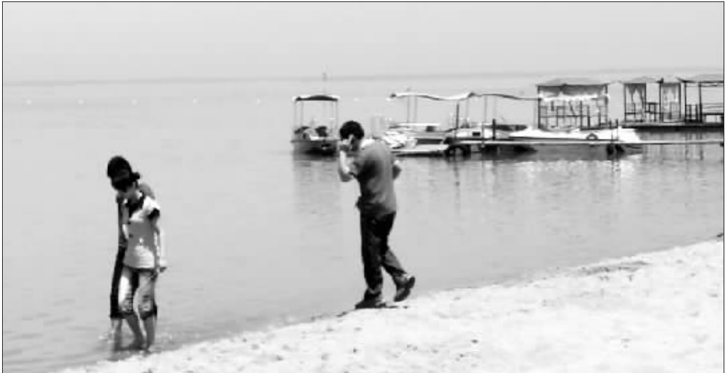
骆马湖远近闻名,每到夏天就有不少游客来这里游玩

宿迁市某机关一位不愿具名的官员对记者称,“宿迁旨在通过骆马湖的包装,发展旅游,促进招商引资!”他称,骆马湖更名为马上湖,只是包装方案的一个很小的部分。宿迁更宏伟的计划是,要投资17.7亿元,在骆马湖上的戴场岛开发一个以英雄美人为主体的园林景观,同时,还要耗资1.5亿元在戴场岛建东方女神(观音寺)和观音塑像及“财运鼎盛”大鼎两口。