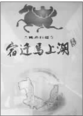
宿迁马上湖的LOGO已经设计出来：一匹马的背上驮着一只蝙蝠