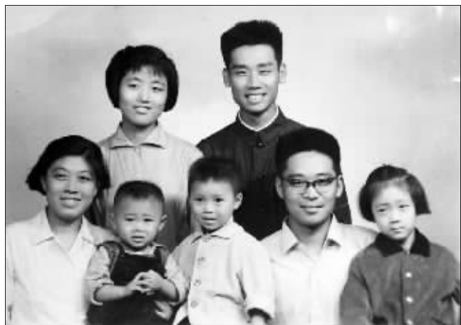
张阿姨小时候的全家福