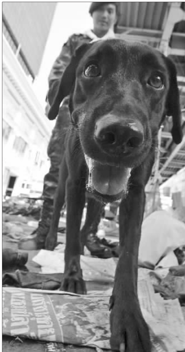
在曼谷街头排查的警察和警犬