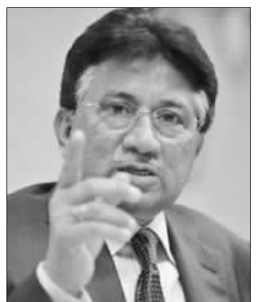
穆沙拉夫(资料图片) 我要回来——设计台词