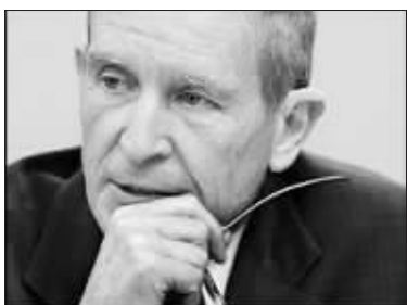
美情报总监布莱尔