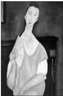
莫迪利亚尼:《持扇的女人》