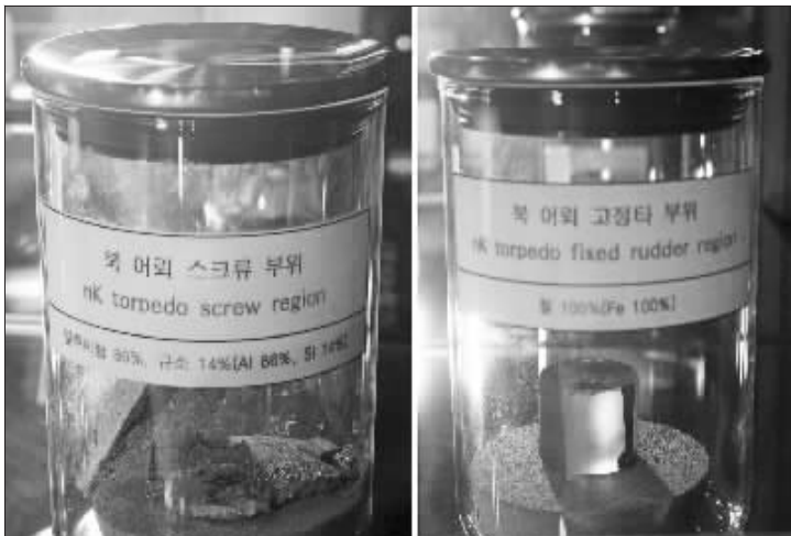
韩国展示的证据之一。

如果韩国对朝鲜进行“惩罚”“报复”或“制裁”,朝鲜将立即采取包括“全面战争”在内的各种强硬对策。