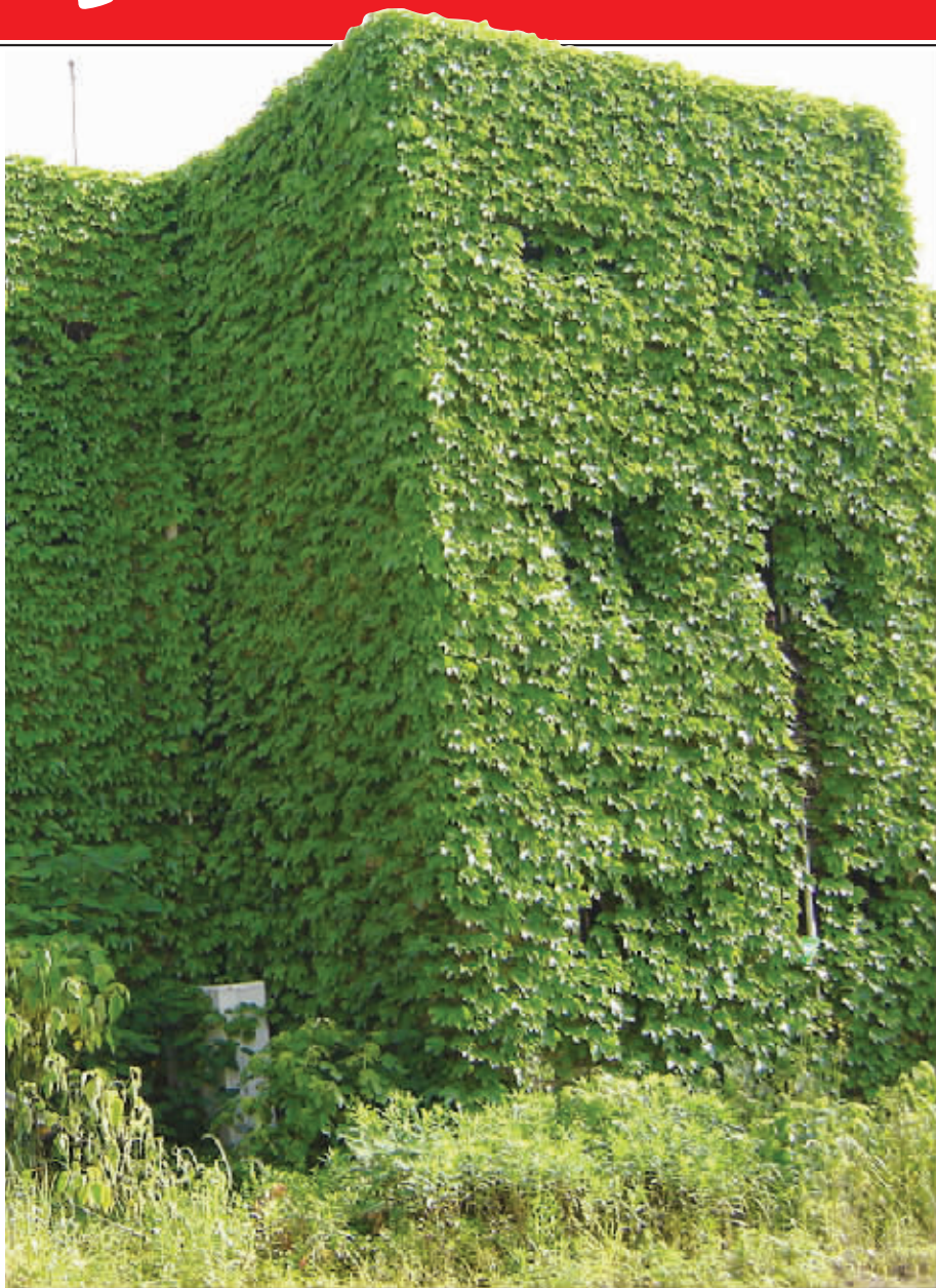
爬山虎覆盖了浦珠路警务查报站