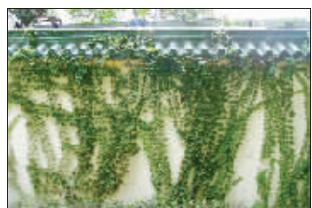
北京东路南空附近的“帘”墙