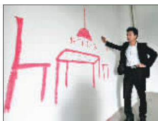
哪里摆放餐桌,她说了算