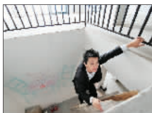
欲寻心上人,更上一层楼