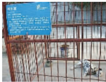
不带走这骗人的啊