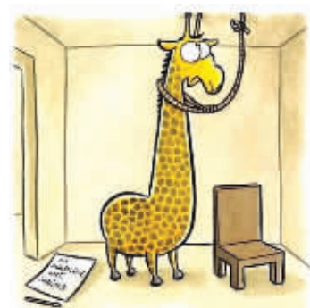
身为一只长颈鹿,死都不容易

http://www.jiongus.com/bbs/ 每天口一下,口的精神无穷大