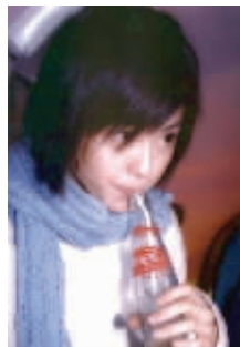
梁咏琪最爱瓶装维他奶,从小喝到大