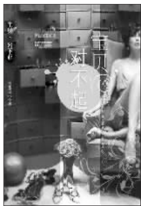
西缙晓芸 著 凤凰出版传媒江苏文艺出版社友情推荐

如果你是“N型人”,建议你善用分期卡前几期免息、免手续费的好处,作为控制每月支出的工具;倘若你是“Y型人”,就不建议使用分期卡,因为无论分不分,到头来还是乱刷一通,沦为新一代卡奴。