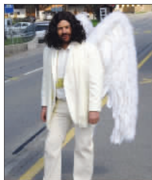
不知这个马路天使管不管用