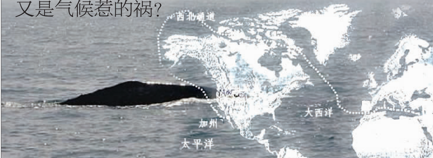
一条灰鲸出现在以色列沿海(灰鲸的迁移路线图,从美国加州到达以色列沿岸) 俞晓翔 制图

据英国《每日邮报》报道,今年5月8日,一头灰色鲸鱼在以色列沿海突然出现,海洋生物学家对此感到非常惊讶,因为这种鲸鱼的家在数千英里外的太平洋。它究竟是如何辗转千里,最后成为地中海这片陌生海域的隐士呢?