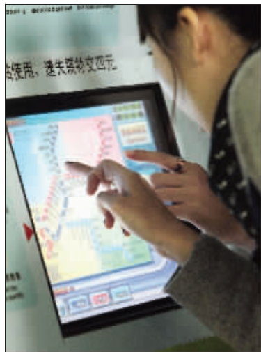
地铁一号线自动售票机上的系统将更新