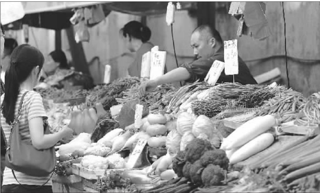
现在去菜场,两元钱以下的蔬菜是越来越少了

有天晚上,葛守昆在看财经方面的书时,突然冒出一句,“股市现在不太稳定,咱们还是寻找其他的投资渠道落袋为安,要不要买黄金?”蒋小姐嗤之以鼻,“买黄金,你懂吗?听说一根一两万,我是下不了手。”老公劝她,黄金是硬通货,在物价高涨、房市和股市都疲软时,最好的投资就是黄金。“这个是保值的,要不哪天咱们去商场转转看。”