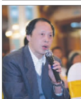
参会者踊跃提问,让受访者接不暇