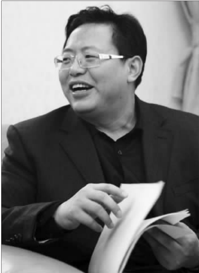
南京市政府新闻发言人曹劲松接受快报专访

曹劲松说,“我们对于这一类问题,要参与到社会管理中来,出于公共利益提出意见建议,希望政府采纳。这时网络发言人要扮演一个很好的沟通者的角色,一旦在舆情信息的背后有一诉求,那么对于社会稳定将起到很大的作用。”