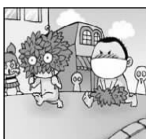
请作者与本编辑联系