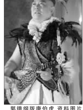
郭德纲版唐伯虎 资料图片