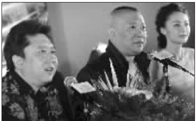
郭德纲、于谦等参加记者会

上影国际影城:10:40 12:25 13:05 15:35 16:40 18:00 19:40 20:30 21:20 新街口国际影城:10:20 13:05 14:20 15:05 16:35 17:25 18:50 19:20 21:05 万达国际影城:10:10 12:30 13:00 14:50 15:20 17:10 19:30 20:00 21:50 和平影城:10:20 13:05 14:20 15:05 16:35 17:25 18:50 19:20 21:05