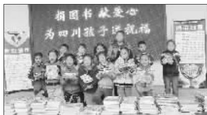
孩子们捐出了自己心爱的图书

从4月12日-4月23日,由快报主办的“捐图书、献爱心,为四川孩子送祝福”之“万人签名送祝福”活动将让“祝福”漂流过12个地点。今天,我们于11:30-12:00在南京十三中举行相关签名活动。欢迎广大热心读者积极参与我们的活动,为灾区的孩子们送去大家的祝福与关心。