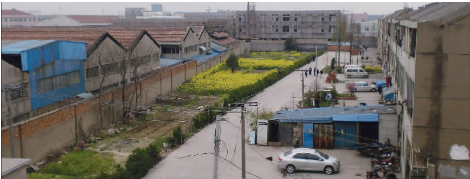
居民区被6家工厂包围,居民饱受污染苦不堪言