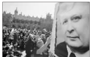
一名男子手举卡钦斯基遗像等待葬礼开始