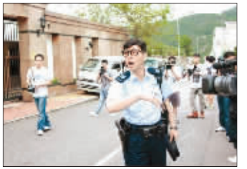
上图:助手陪谢霆锋赶到医院 中图:张柏芝姐姐戴碧芝到场 下图:警员驾到驱赶媒体记者