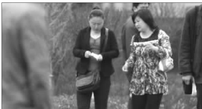
“花巧女”(图右者)向路人行乞

“你们等着看,我就站在一个站点,一会就能要到钱了。”“花巧女”坦然地站在站点前,路过的行人走到她身边,她就很大方地走上去,“我没钱坐车了,能不能帮忙呢?”“花巧女”的脸上挂着笑,