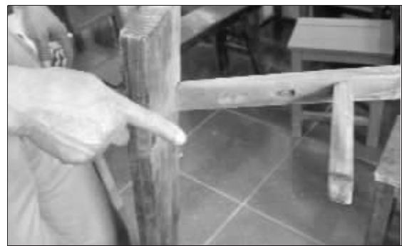
板凳也缺了一条腿