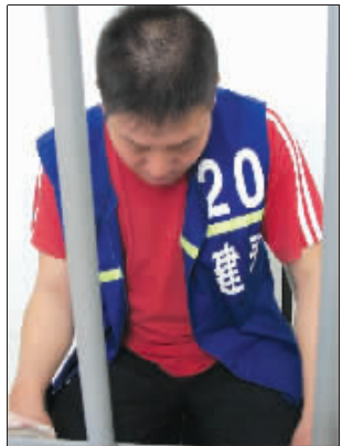
肇事者被拘20天

5月4日, 快报报道了一起离奇车祸: 5月3日晚上8时10分左右, 在建邺区文体路沿河一村小区附近, 一辆红色吉利轿车狂冲100多米, 撞倒了一名骑自行车的中年男子后, 又撞倒停在路边的两辆自行车, 最后撞向一棵大树后停下来。事故发生后, 车上多名男子离开现场, 而在后备箱里, 却放了多把砍刀。日前, 逃逸司机已自首。