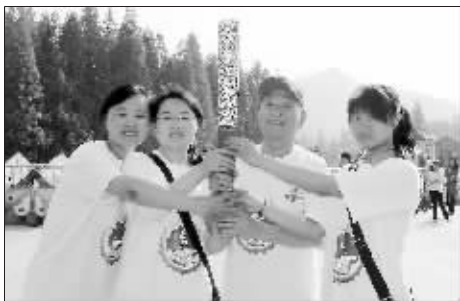
▲朝气蓬勃的青年登山者们