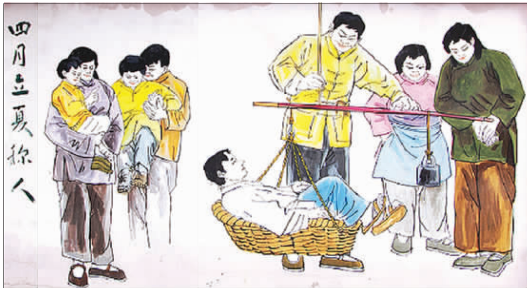
立夏称人 资料图片