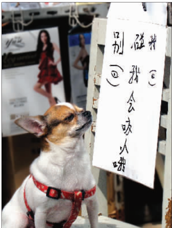
锁金村路边小店前,小狗狗在“别碰我!我会咬人哦!”的告示牌前眯起了眼,一副不开玩笑很认真的样子。 (作者小丽将获30元话费)