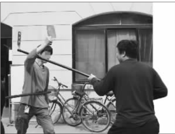
玄武警方给学校配发近两米长的警棍