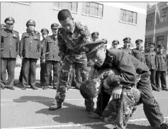
建邺警方对专职校园保安进行实战培训