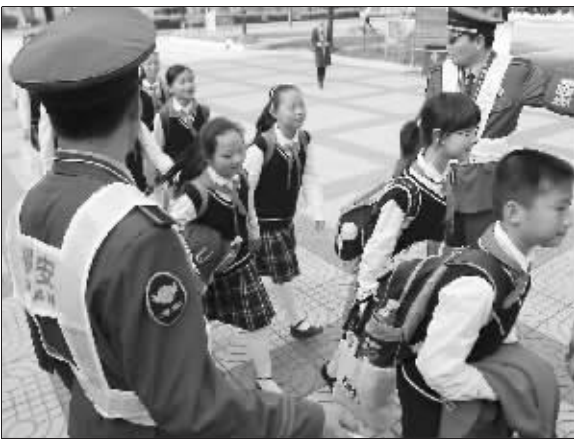
鼓楼区对每所学校派驻保安