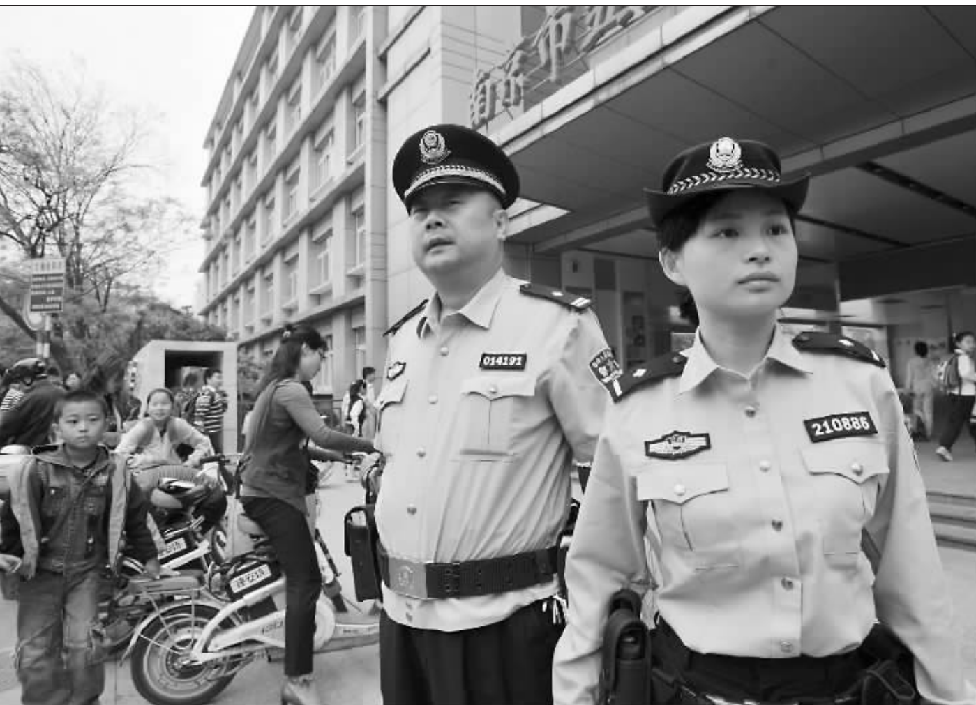
在上下学高峰时段,南京警方全力护卫校园安全

“如果不想南平惨案(在)无锡重现的话,我想和你谈谈……”4月26日,无锡新区春星小学负责人收到一封写有上述文字的敲诈信。经过7昼夜侦查,昨日无锡警方宣布该校校园恐吓敲诈案成功告破,安徽籍嫌犯刘某已经正式被刑事拘留。