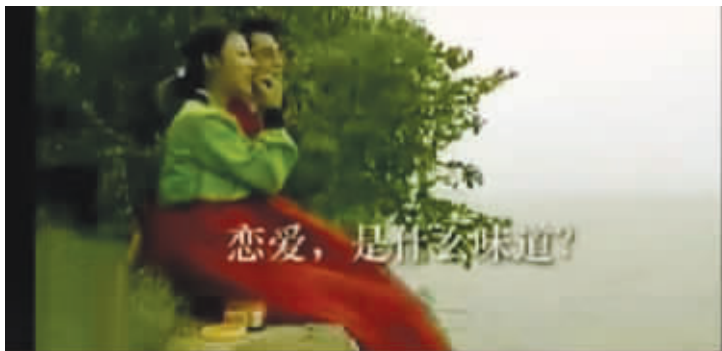
两个人在恋爱的时候,旁边还不忘一罐泡菜。恋爱,应该是泡菜的味道吧!

“青春是什么味道? 恋爱是什么味道? 思念是什么味道? 泡菜是什么味道?”近日,这样一句广告词,让广大网友在闪电般袭来的炎炎夏日中,感到了丝丝凉意。这句广告词出自一款泡菜广告,广告中一对男女从相遇到恋爱、相守,从未离开过泡菜的味道,甚至在拥抱时也手拿泡菜罐子,让网友感叹:“冷得我胳膊都麻木了!”