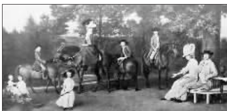
最右边树下的是达尔文的父母