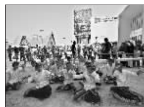
印尼馆开馆仪式的歌舞表演

西?而法国馆里这些都有,这也让法国馆成为最有“女人缘”的场馆,游览完之后还在滔滔不绝地讨论着,对之留下深刻的印象。