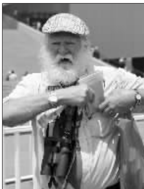
“圣诞老人”也来游世博?