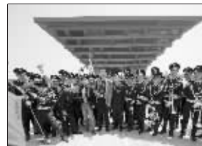
中国国家馆成合影最佳背景