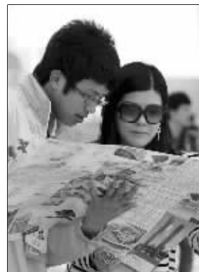
志愿者在为游客指路