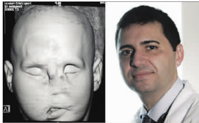
巴雷特和“神秘人”手术前面部核磁共振图