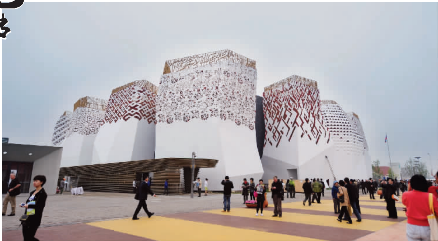
漂亮的俄罗斯馆是由江苏承建的

地域相邻,让江苏得以成为上海举办世博会最得力的伙伴。15处场馆“江苏造”,而且承担的都是英国馆、沙特馆、俄罗斯馆等最有特色、建造难度最大的;还有手机门票、海宝毛绒玩具、园区里的交通工具……吃、穿、用、行、游,在世博园里,记者到处都可以看到“江苏元素”在熠熠闪光。对江苏人来说,世博会,我们不仅是游客,也是重要的参与者和建设者。