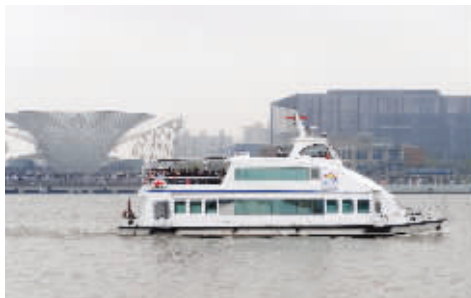
江苏制造的世博游船