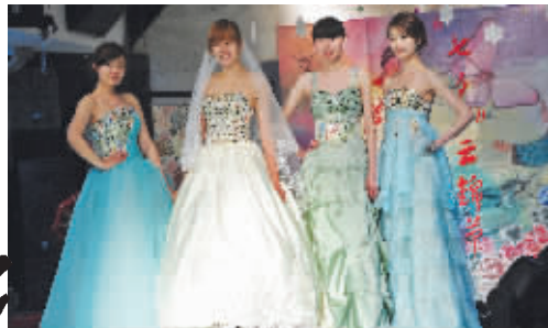
南京云锦将亮相世博