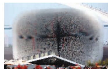
“种子殿堂”英国馆也由江苏包揽设计和施工

客流是否过大,是游客们关心的;世博会上人流如何?为此,世博会特别安装了客流量拥挤度软件分析系统。这套系统的制作就来自镇江石鼓文智能化系统开发有限公司,利用这套软件分析系统,管理人员可以通过这个系统来控制客流量:当一个馆中的客流量超过接待负荷时,便于及时引导这部分客流先分散到其他场馆。此外,当某个场馆的客流较多时,也及时调配工作人员和志愿者前往服务。