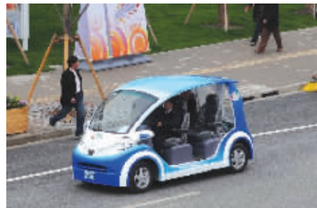
观光电动车也有“江苏造”