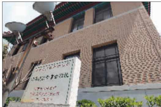
旧址刚换上近400万元的“新外衣”