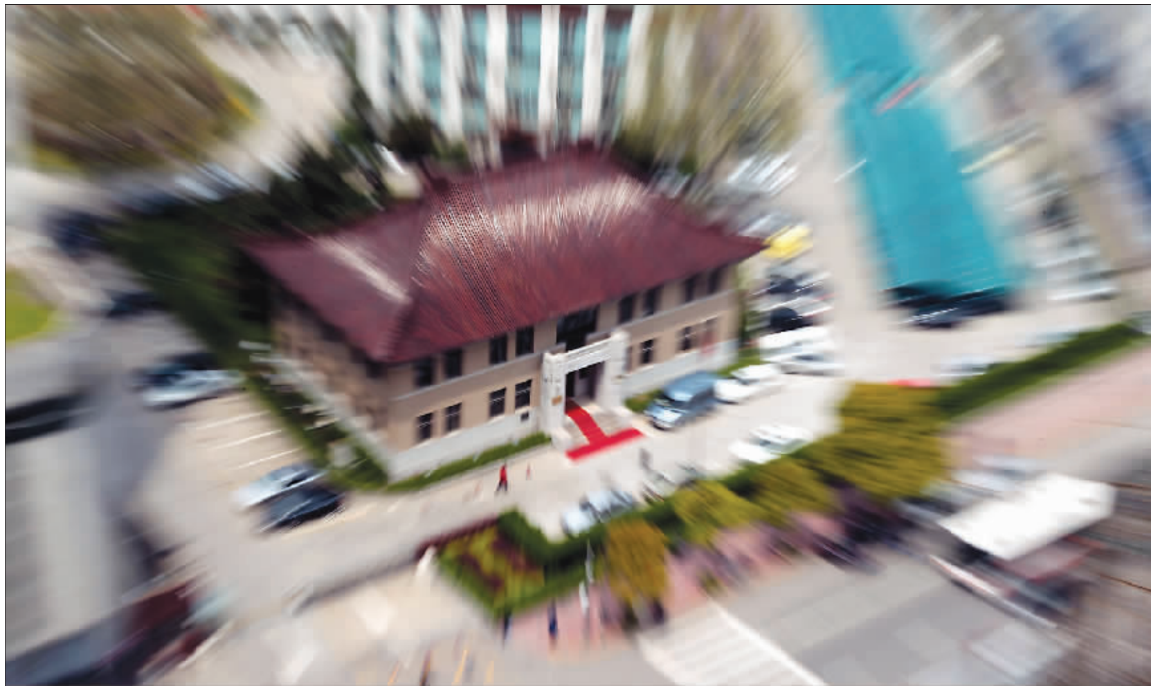
位于山西路124号的中英庚款董事会旧址在车辆川流不息的闹市中很是惹眼