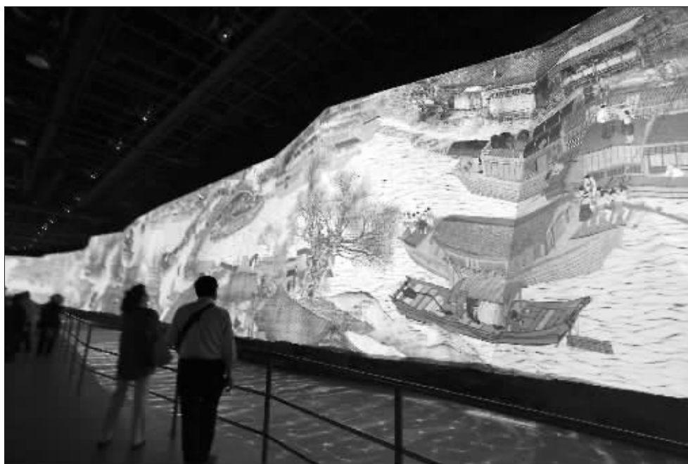
中国馆里的巨幅三维画《清明上河图》

在“低碳行动”展区,除展示了充电汽车外,最吸引人的就是有一个不停转动的钟,你随便点一下,它会告诉你,这个时间段如何才低碳。