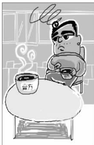
制作膏方不似煲汤,是个技术含量很高的活,一般吃自制膏方不但可能没有效果,反而可能有后果

最近的天气乍暖还寒,捉摸不定,不少白领随即成了感冒的“主力军”。到医院看病挂号麻烦又花钱,不如上网搜些简单药方自己治。在各大养生健康论坛上,各种中医药方、膏方帖颇受网友青睐,大家不但根据帖子在家DIY,还把服用心得“晒”到网上。专家指出,自己治病需谨慎,由于个人体质差异,流行的药方、膏方,并非人人适用。