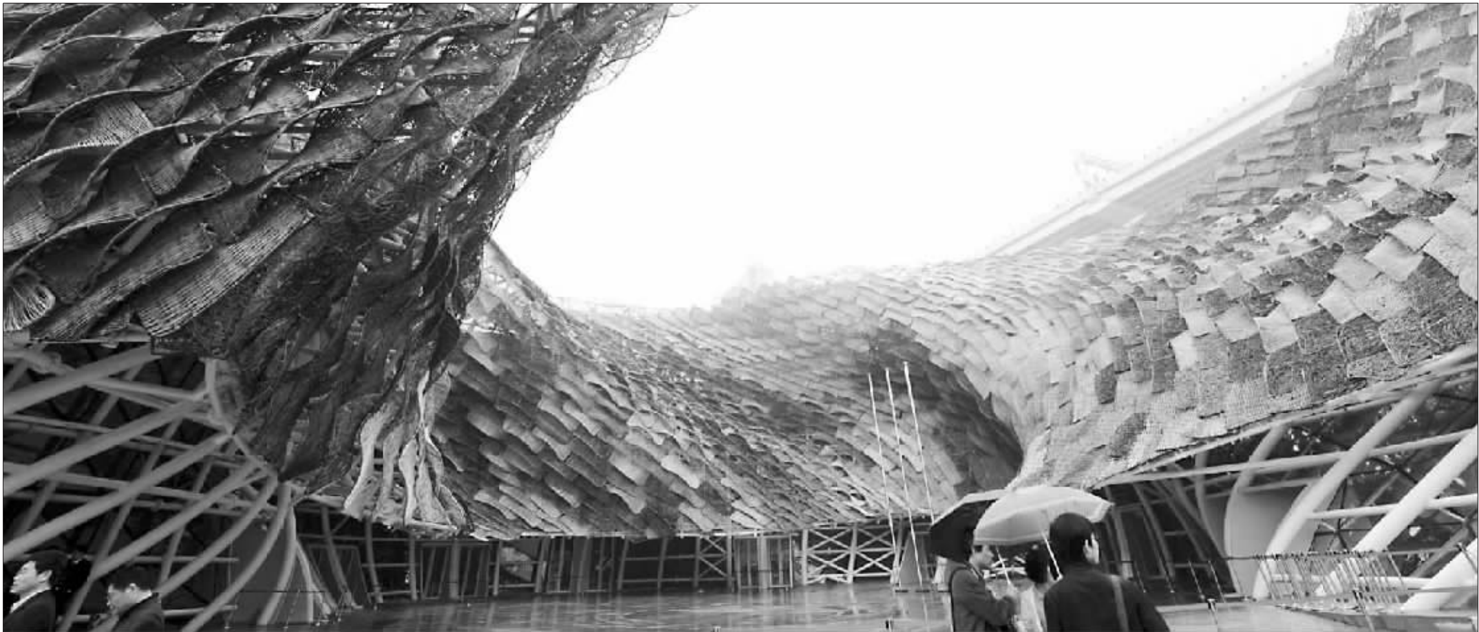
西班牙馆是个用藤条编出的“大篮子”造型,藤条外墙上还有一些图案,能清楚地分辨出“日”“月”这些汉字