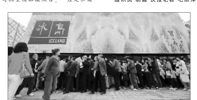
园区内,这样长长的队伍几乎随处可见