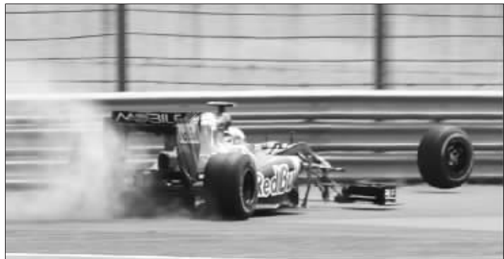
布埃米的赛车前胎飞出去了