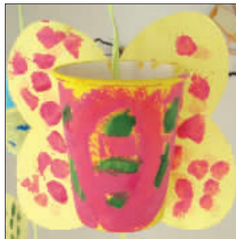
《蝶变》金天 鼓楼幼儿园大班