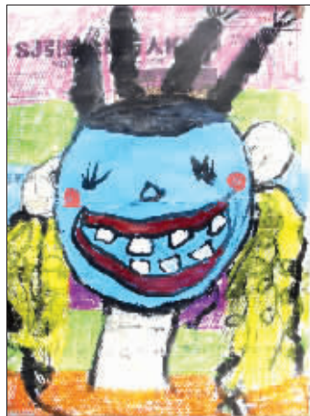
《大嘴美女》夏之晨 5岁 高淳淳西中心幼儿园大班