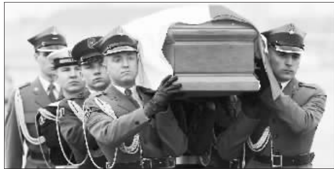
波兰第一夫人灵柩运抵华沙机场

兰公共电台宣布,卡钦斯基夫妇的葬礼将于本月18日举行,他说:“本周六(17日)计划举行悼念仪式,接下来在18日,将举行总统夫妇的葬礼。”