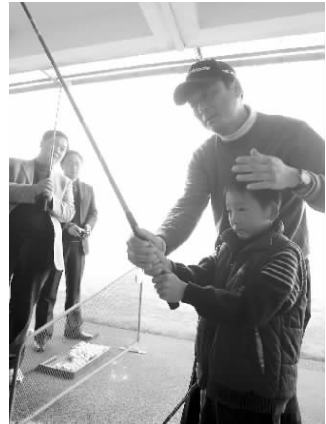
在资深教练调教下,小圈友过了把“绿色鸦片”瘾

圈圈网记者也盘算着在MM面前秀一把。众目睽睽之下,他挥空三次后,终于让球“滚”了出去。一旁的小朋友实在看不下去了,规劝说:大哥哥,