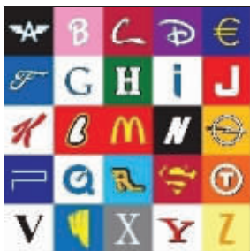
浪漫哥作品：Only I need is U!