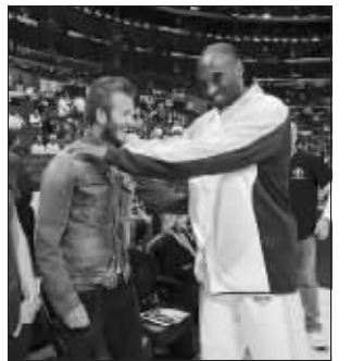
赛前科比与小贝聊天

目前正在养伤、已铁定缺席世界杯的贝克汉姆昨天出现在湖人主场对阵开拓者的比赛现场。赛前,小贝还与科比、加索尔场边进行了亲切交谈。