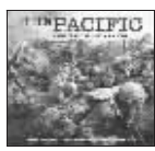
《太平洋战争》 艺人:Hans Zimmer 时间:2010-03

三张 DVD,五月天 live10 年演唱会影音全记录,世界上已经超过 30 万人的 DNA 在这里放肆地活起来!