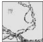
《L&R》 艺人:惘闻 时间:2010-04

惘闻第五张专辑《L&R》,绝对是中国摇滚几年来少有的情绪饱满之作。每一曲的抱负展成整张专辑的雄心勃勃。