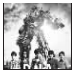
《DNA》 艺人:五月天 时间:2010-03

惘闻第五张专辑《L&R》,绝对是中国摇滚几年来少有的情绪饱满之作。每一曲的抱负展成整张专辑的雄心勃勃。