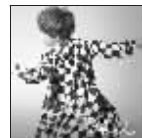
《谭某某》 艺人:谭维维 时间:2010-03

热门美剧《太平洋战争》的电视原声,慢节奏的音乐几乎贯穿了整部剧,不时地提醒着观众应该在何时感到伤心。