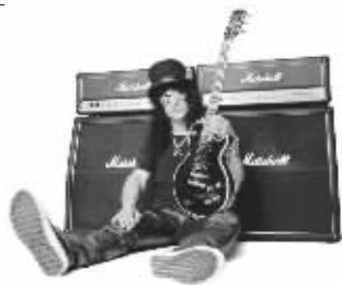
主唱亚当·莱文、前涅槃乐队鼓手戴夫·格罗尔等众多明星都为专辑献上歌喉。

美国前 Guns N' Roses 乐队吉他手 Slash 首张个人同名唱片。专辑中大部分歌曲的创作是由 Slash 完成的,每首歌的主唱则由他亲自挑选。黑眼豆豆的女主唱菲姬、摩托头的主唱 Lemmy Kilmister、Maroon 5