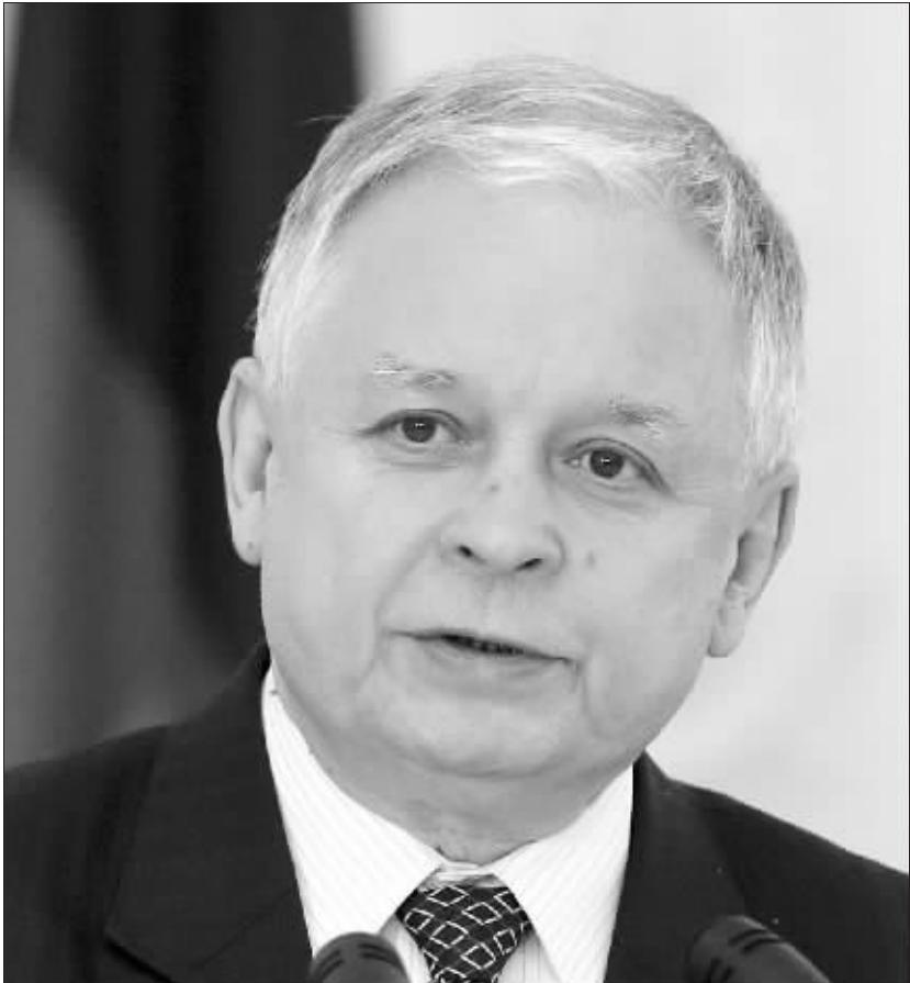
图为2010年4月8日,波兰总统卡钦斯基在立陶宛维尔纽斯出席记者会