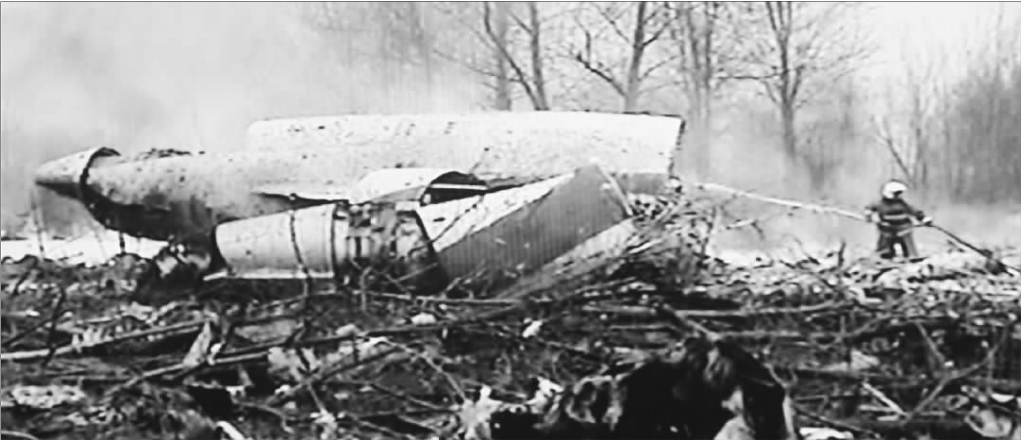
这张4月10日拍摄的电视截图照片显示,波兰总统卡钦斯基乘坐的飞机在俄罗斯斯摩棱斯克机场附近坠毁后的现场