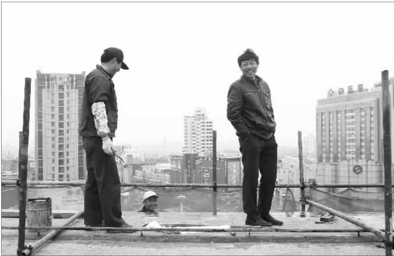
“新农市民”有了同城待遇,农民工兄弟当然乐了